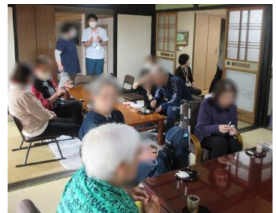
終了後はお茶でまったり♪